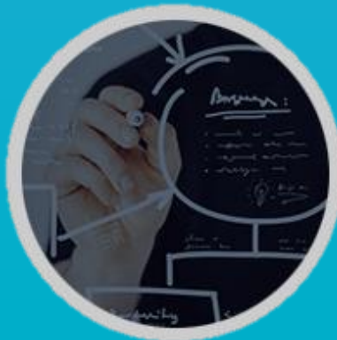
El nuevo pizarrón