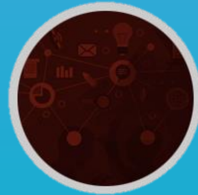
Administración de Proyectos